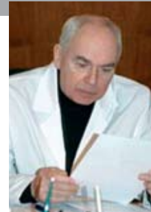
Министр здравоохранения Российской Федерации, член-корреспондент РАН В.И. Скворцова

Желаю слушателям, организаторам, участникам и гостям Школы успешной и продуктивной работы в теплой и дружеской атмосфере Республики Крым.